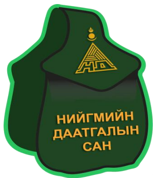
Нийгмийн даатгалын сангийн зарлага /Тэрбум төгрөгөөр/

2016 оны 09 дүгээр сарын 30-ны байдлаар 882,1 тэрбум төгрөгийн орлого төвлөрүүлж, орлогын төлөвлөгөөг 101.6 хувиар давуулан биелүүлжээ.